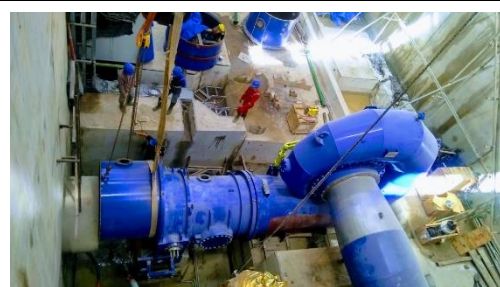
発電タービン手前の清流装置セット