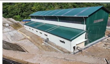
パワーハウス（発電機室）と コントロールルーム全景