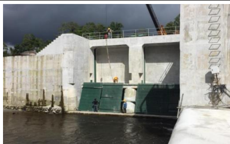
取水口の防ゴミネット設置