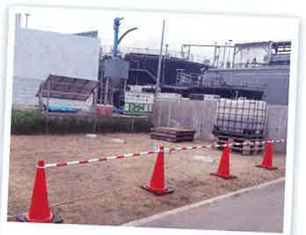
バイオ液肥スタンド1号

また集落的にご使用にされたい場合は、別途設置に向けた相談も対応していますので、お声がけください。