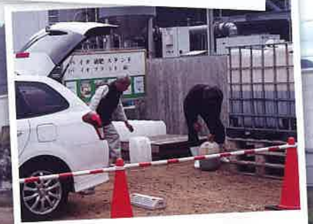
車への積み込みの様子